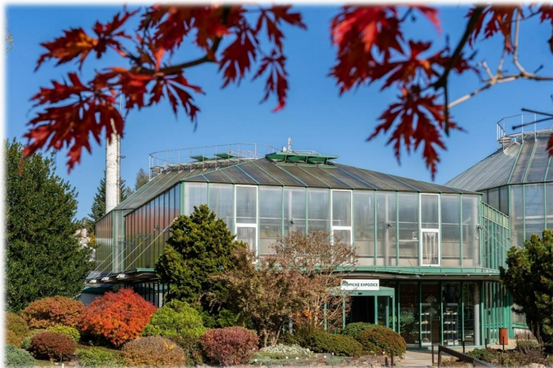
foto: vstup do tropických skleníků

ORIENTÁLNÍ ZAHRADA – Od jara do podzimu expozice nabízí pohled na vystavenou bonsaj – jalovec čínský ( Juniperus chinensis 'Echiniformis').